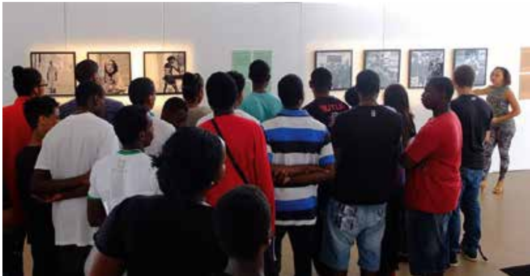
Visite guidée à l'EnCRe pendant l'édition 2014.

" UN HOMMAGE À LA BEAUTÉ DE LA PLANÈTE "